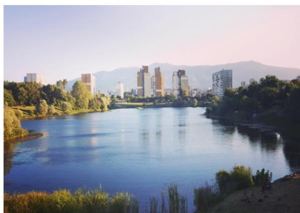
Езерото в нашият квартал