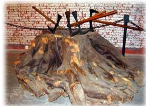
Църквата „Света Неделя” в Батак